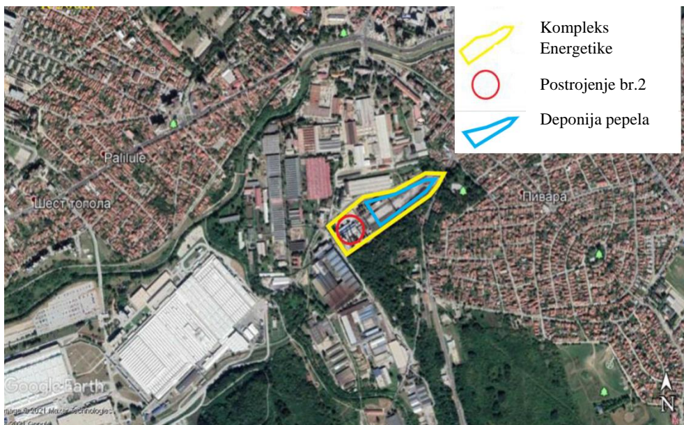
Slika 1 – Toplana „Energetika“ i lokacija deponovanog pepela

Pepeo će koristiti kao građevinski materijal i ugrađivati u telo puta, u skladu sa Pravilnikom o tehničkim i drugim uslovima za pepeo kao građevinski materijal namenjen za upotrebu u izgradnji, rekonstrukciji, sanaciji i održavanju infrastrukturnih objekata javne namene ( Službeni glasnik RS, broj 56/ 2015).