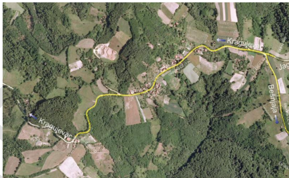
Slika 3 – put Stragari – Kutlovo